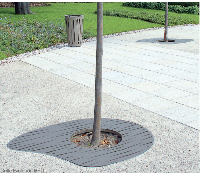
Grille Evolution B+C