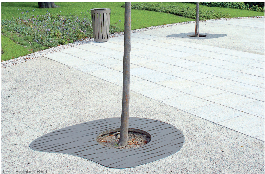
Grille Evolution B+D

Grille tout acier r alis e en t le  paisseur 8 mm et renforts en plat 25 x 6 mm. Compos e de deux demi- l ments. Cadre en corni re acier 40 x 40 x 4 et rond   6 mm pour scellement Un angle du cadre point  pour passage du tronc d'arbre.