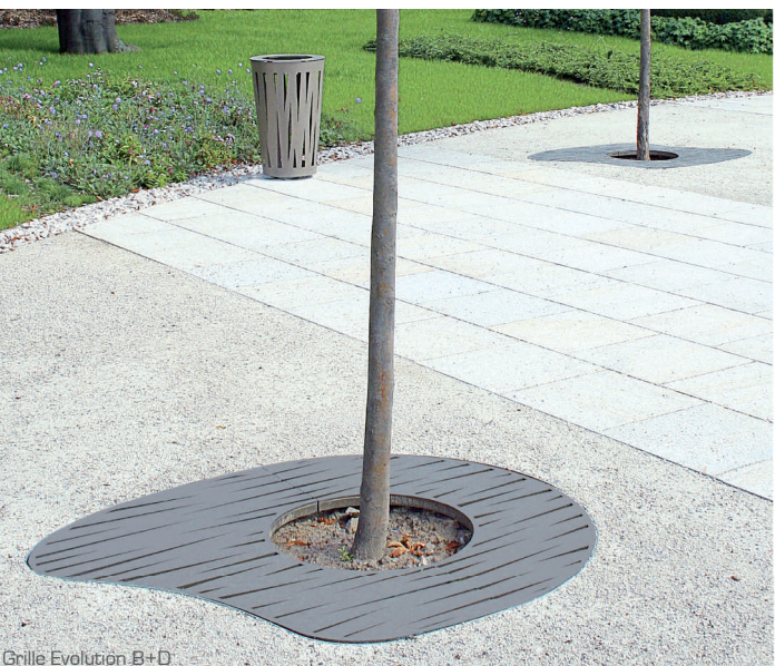
Grille Evolution B+D