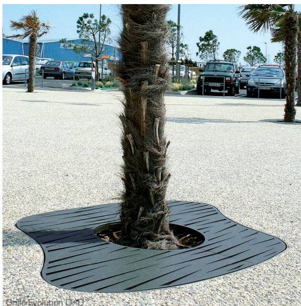
Grille Evolution D+A