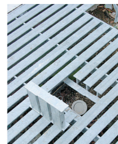
Trappe de drainage