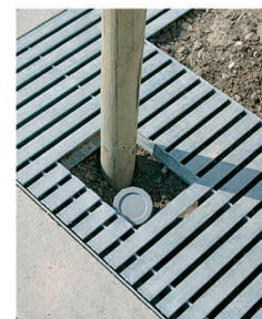
Trappe tuteurage + drainage