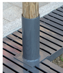
Embase pour tuteur bois